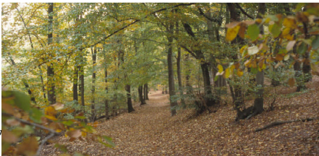
Beukenbos op de Duivelsberg

Dan hebben de diverse bossen ook nog hun eigen kwaliteiten.